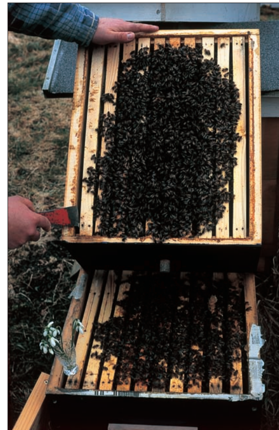
Nur selten sind Bienenvölker nach der Überwinterung so stark wie hier, dass sie zwei Langstroth-Magazine besetzen. Die meisten Völker sollten um diese Zeit etwas eingengt werden; bei Überwinterung in zwei Räumen wird dabei meist der untere Raum entfernt.

Bei dieser ersten Durchschau sollte man nach Möglichkeit dennoch zurückhaltend sein, was das Ziehen von besetzten Waben betrifft. Bei den noch etwas kühlen Temperaturen sind die Bienen weniger beweglich, haben weniger Halt an der Wabe und bilden oft noch dicke Trauben in den Wabengassen. Wenn man daraus Waben zieht, fallen oft zahlreiche Bienen