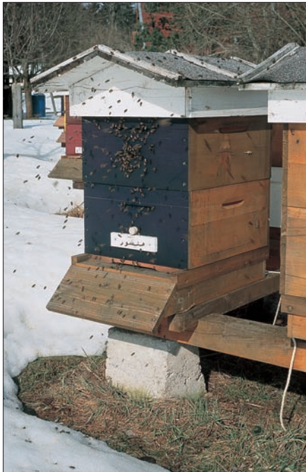
Beuten mit geschlossenem Boden sollten im Winter unbedingt eine zweite Öffnung im oberen Beutenbereich haben. Häufig erfolgt der Reinigungsflug aus dieser heraus.

Gelegentlich sind Bienen einzelner Völker überbelastet. Sie sind nahezu flugunfähig und koten im Bereich um das Flugloch sowie im Inneren der Beute ab. Normalerweise sind hier Krankheiten wie Nosema oder auch Spätfolgen einer Varroaüber-