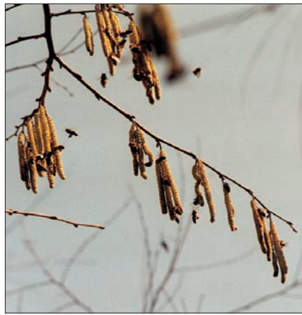
In vielen Gegenden blüht im Februar oft schon die Hasel und beschert den Bienen eine erste Pollentracht, die sie in schwefelgelben Höschen eintragen.

Doch eines erledige ich dennoch nach Möglichkeit sehr früh: das Einengen der Völker. Nicht besetzte Waben aus dem Randbereich der Dadantbeuten werden teilweise entfernt. Dabei ist auf die Gesamt-Futtermenge zu achten; Waben