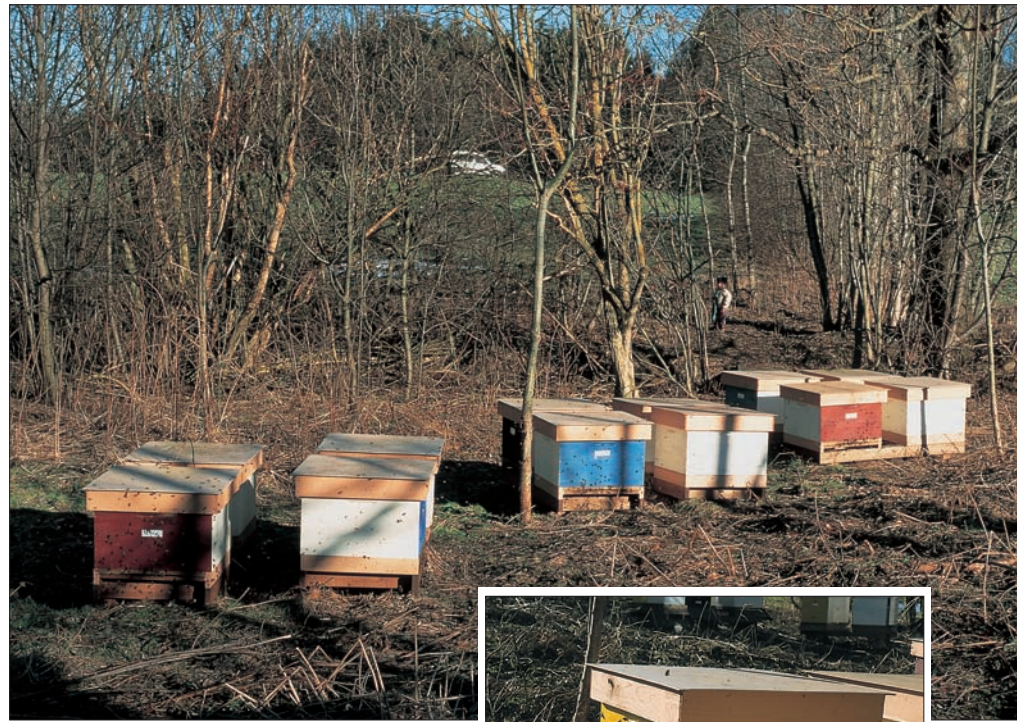
Eine wichtige Hürde bei der Überwinterung ist genommen: Der erste Reinigungsflug findet statt. Für den Imker ein herzerfreuender Anblick.

Ich bezeichne die Zeit von Anfang Februar bis zur Frühlingstagundnachtgleiche als eigene Jahreszeit: Spätwinter. Den Beginn feierten unsere Vorfahren mit einem Fest, an dem das Licht erstarkt: Lichtmess oder, wie es bei den Kelten genannt wurde,