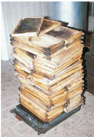
Gestapelter Wabenturm. Die Waben sollten nicht wie hier unsortiert, sondern sortiert eingeschmolzen werden. Wachs aus Baurahmen bzw. sauberen Mittelwänden ist strikt von belastetem Wachs zu trennen.