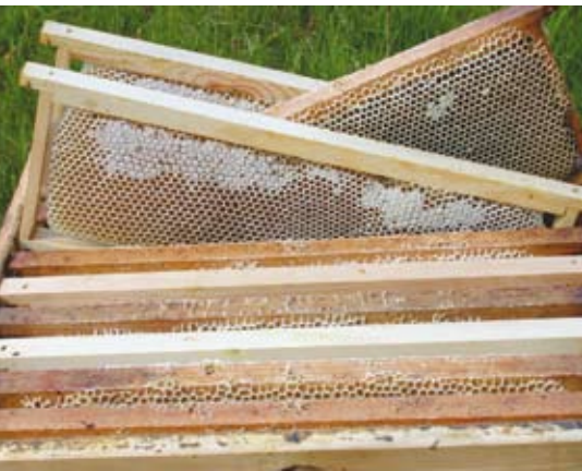
Im Honigraum mit Halbzargen lässt sich recht gut Neuwachs gewinnen, indem man zwischen die Waben abwechselnd gedrahtete Rähmchen einhängt, die die Bienen im Naturbau ausbauen.