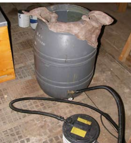
In einer Plastiktonne lässt sich mit dem Dampfmeister sehr gut Bauahmen- und Restwachs einschmelzen. (s. a. 08-01-03).