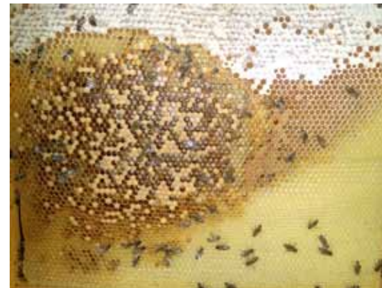
Wabe mit sogenanntem „Schrotschuss-Brutbild“ – nahezu alle Bienenlarven starben während der Entwicklung ab.

Die Schwierigkeit ist aber vor allem, dass es für Bienenwachs keinen verbindlichen Qualitätsstandard gibt, wie Gann auch bei seinem Vortrag beim Berufsimkertag in Donaueschingen eindrucksvoll darlegen konnte. Damit sind der Panschelei Tür und Tor geöffnet. Erschwerend kommt hinzu, dass Bienenvölker einen gewissen Anteil von Verfälschungen akzeptieren und auch aus „unsauberen“ Mittelwänden Waben ziehen. Weiterhin kann man dem Wachs nur schwer ansehen, ob es verfälscht ist (siehe auch November-Ausgabe, Seite 8).